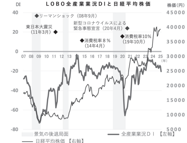
業況DI (※DI=「好転」の回答割合-「悪化」の回答割合)

遊園地「賃上げに努めているが、なかなか人材が集まらない。年度末に向けて短時間バイト等のスポットワーカーを活用する予定である」