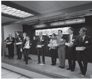
新年交礼会の会場にて

新春交礼会では、来賓と会員による商売繁盛と参加者の皆様の益々のご活躍とご健勝を祈念しての恒例の「豆まき」を行い、威勢の良い掛け声で「鬼は外、福は内」を唱和して、終始和やかな雰囲気の中で、歓談が行われました。