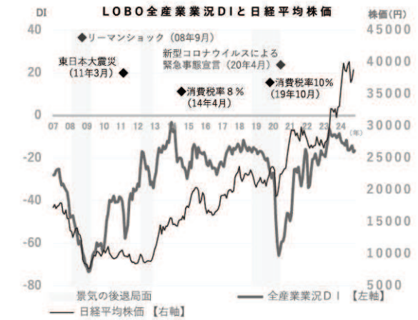
業況DI (※DI=「好転」の回答割合-「悪化」の回答割合)

運送業 「人手に余裕があると思っていたが、少し多忙になると業務が回らないことが増えてきており、危機意識が出てきた」