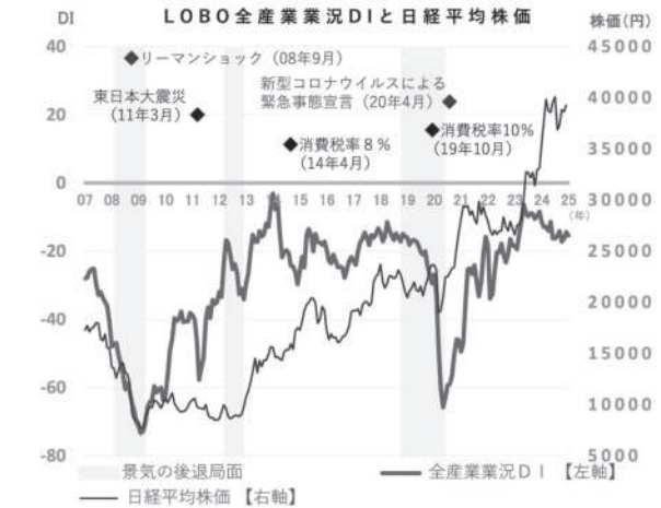
業況DI (※DI=「好転」の回答割合-「悪化」の回答割合)

ソフトウェア業 「大型案件の受注に成功し、これに伴って設備投資・人材確保が必要のため、金融機関へ相談し、無事に資金調達できた。コスト増で経営は依然として苦しいものの、新規事業の立ち上げも控えており、これからの展望に期待している」