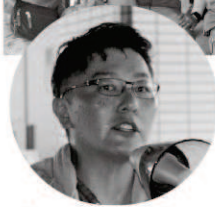
説明する小田委員長